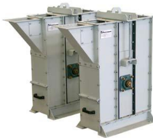
Нижняя секция с загрузочным бункером