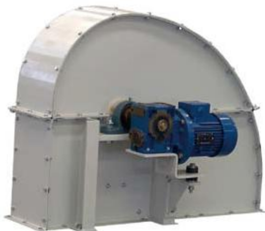
Верхняя секция с мотор-редуктором